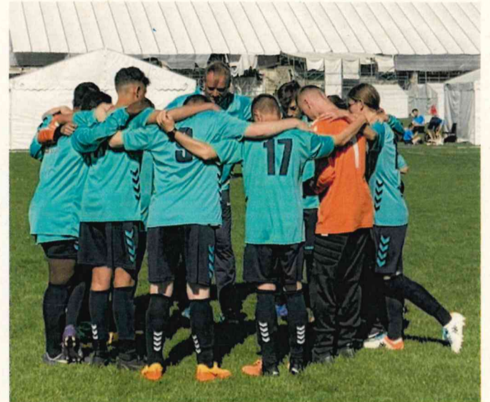
letzte Worte im Mannschaftskreis

Jetzt heißt es ablenken, Kraft tanken und morgen mit frischem Wind in die Gruppenphase starten. Wir lassen die Köpfe nicht hängen. wir sind Lübeck!