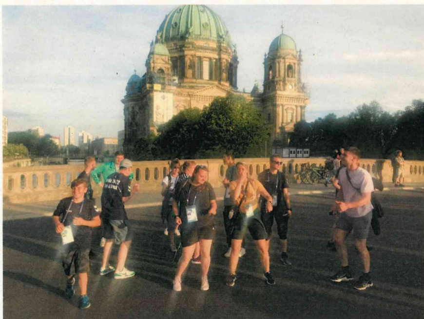
Tanzeinlage vor dem Berliner Dom