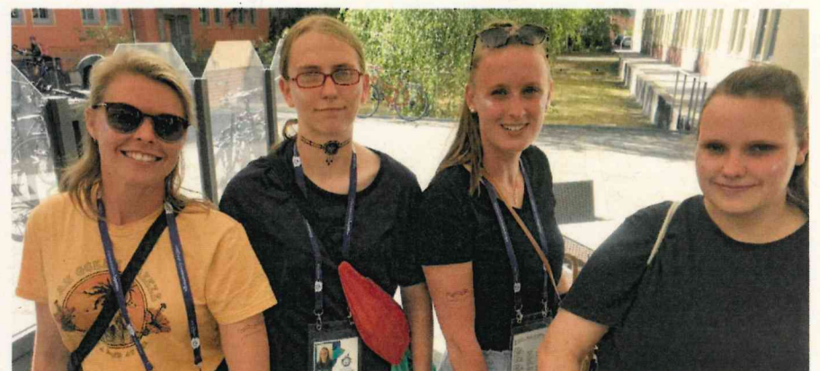
so rausgeputzt kann es losgehen...